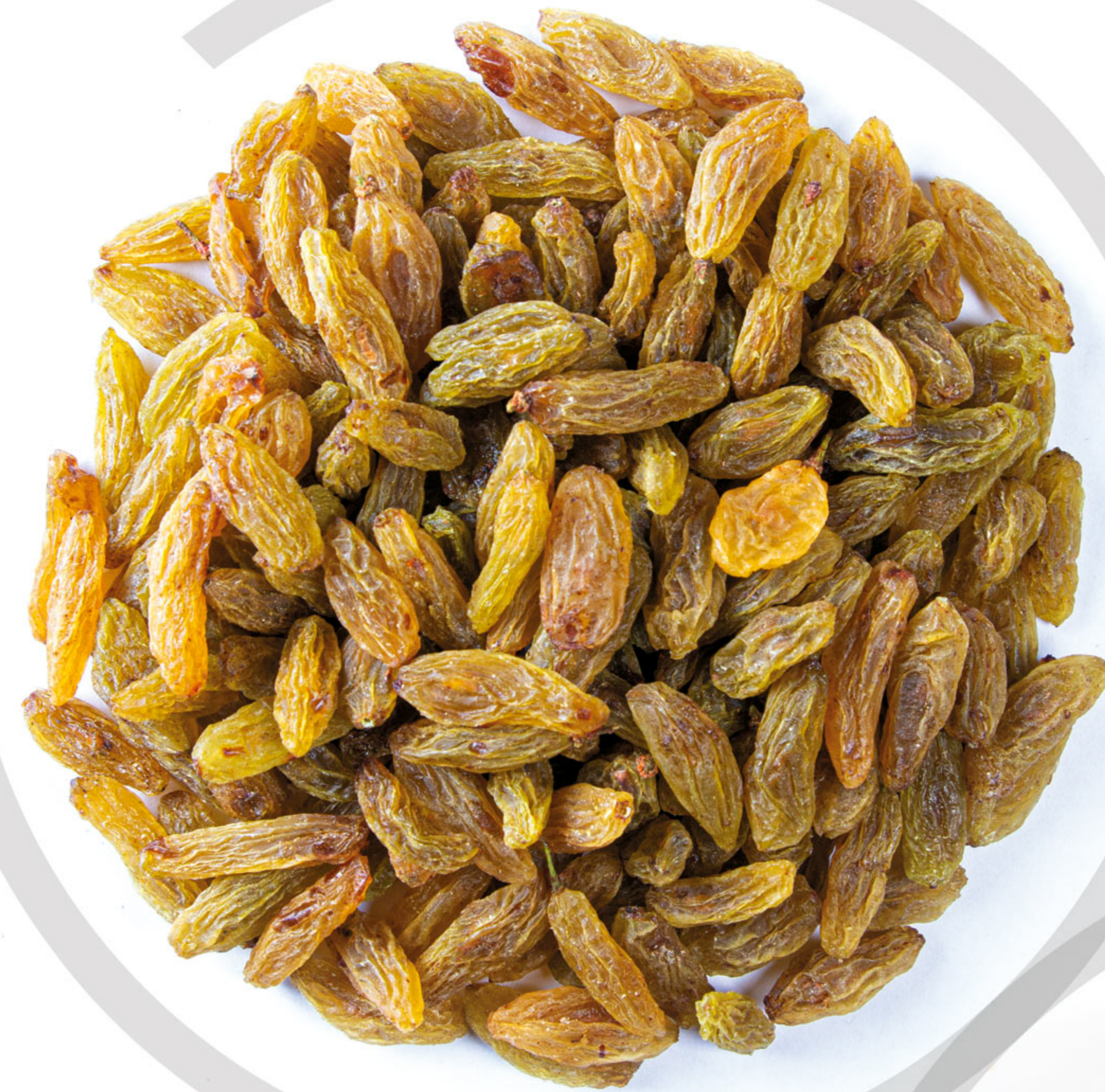
کشمش سبز قلمی Green Raisins

کشمش از خشک کردن میوه انگور به دست می‌آید. فرآیند خشک شدن دانه‌های انگور باعث افزایش میزان مواد مغذی و قندهای موجود در آن می‌شود و از نظر مواد مغذی و کالری بسیار غنی‌تر از انگور است. زادگاه کشمش خاورمیانه بوده و سپس به اروپا منتقل شده است. از نظر تاریخی کشمش به عنوان ارز رایج و پاداش در رویدادهای ورزشی و برای درمان بیماری‌هایی مانند مسمومیت غذایی مورد استفاده قرار می‌گرفته است. شرکت بین‌المللی آفتاب پارلان ارس به واسطه قرار گرفتن در جغرافیای اصلی تولید این محصول در ایران و ارتباط با تولیدکنندگان میوه انگور، خود این میوه را تامین و به صورت کاملاً علمی و بهداشتی فرآیند خشک کردن آن را انجام می‌دهد. به گونه‌ای که خواص ارزشمند این محصول حفظ شده و لذت تناول آن را به مشتریان خود هدیه دهد.