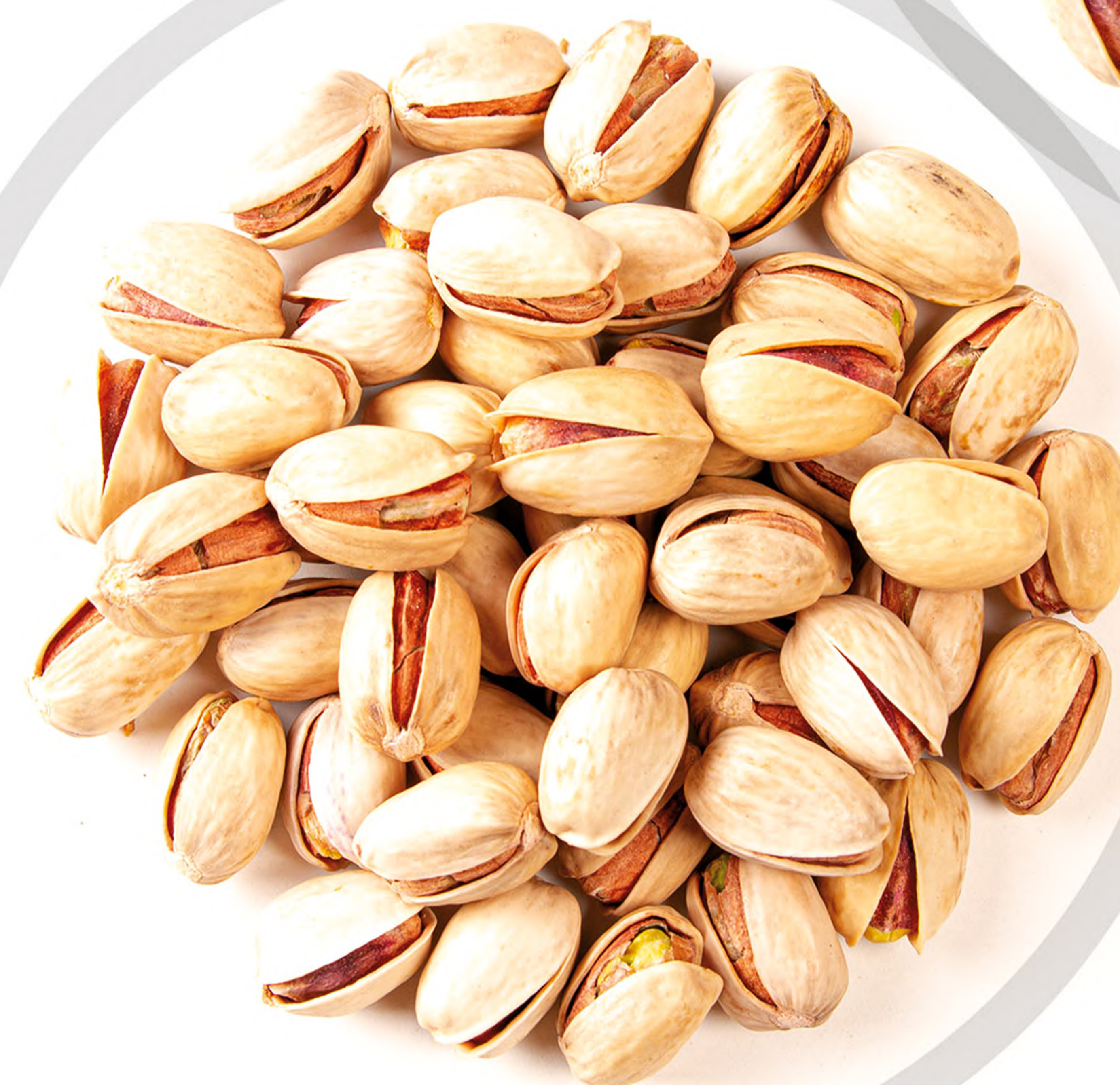
کله قوچی Kalle Ghuchi

یکی از محبوب ترین محصولات آفتاب پارلان ارس که سرشار از از مواد معدنی، پتاسیم، آهن، کلسیم روی، مس و سدیم بوده و ویتامین های ضروری برای بدن مانند ویتامین ث را در خود جای داده است. مجموعه پارلان با تکنولوژی پیشرفته خود مرغوب ترین جنس پسته از انواع احمدآقایی، کله قوچی، فندقی و اکبری را تولید، بسته بندی و در اختیار مشتریان قرار می دهد. این محصول یکی از اصلی ترین محصولات صادراتی شرکت بوده و میزان حداکثری رضایت را به همراه داشته است.