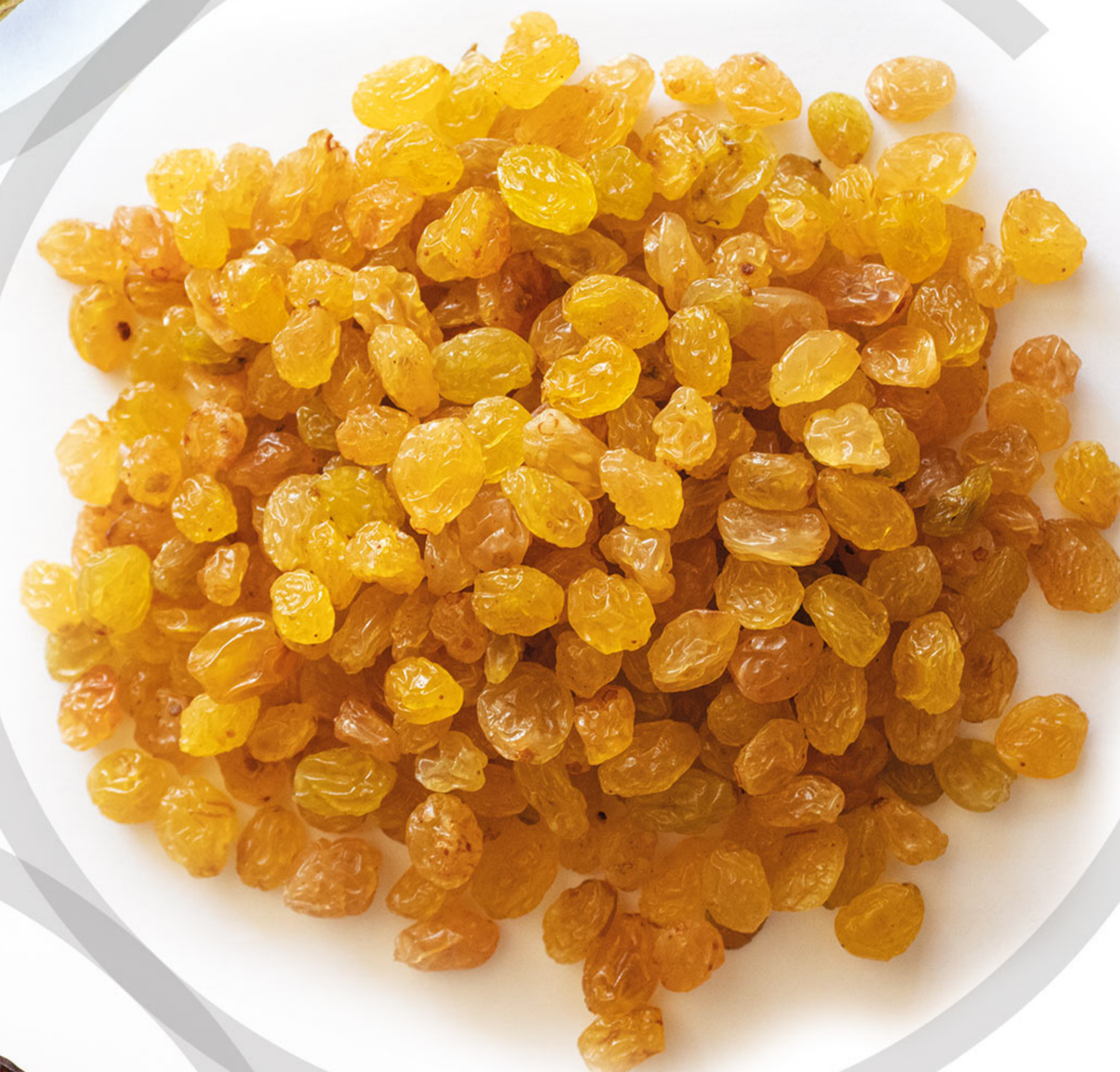
کشمش پلویی Raisins