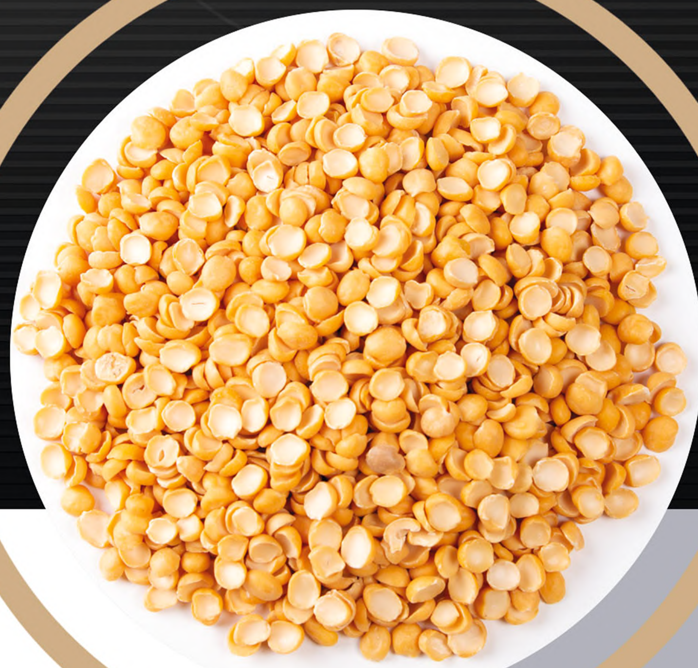
لپه Split peas

Pea, split peas and chickpeas are listed as most consuming products of beans. They are produced in different quality levels and even different sizes. Iranian split peas which is known as one of the best quality products, are produced and processed by Parlan in Azarshahr. This product has advantages for child and elderly people and those who have malnutrition. There are 22 gram protein in each 100 gram split peas. The same amount is existed in peas. Due to its high consumption level in today's people food basket, supplement of beans in highest quality and lowest price is a necessary point to us.