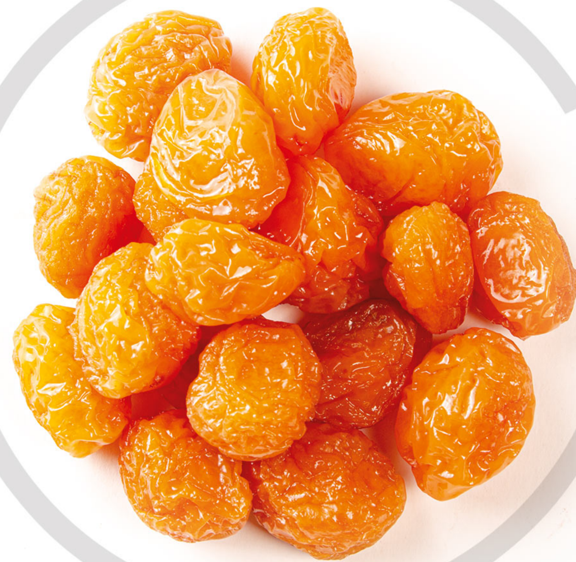
آلو بخارا Prune

میزان کالری در این محصول به اندازه ای کم است که میتوان به راحتی از آن در رژیم غذایی مورد استفاده قرار داد. به جای کالری، میزان فیبر و آنتی اکسیدان در این محصول بالا بوده و در بهبود عملکرد دستگاه گوارش نقش بسزایی دارد. نکته حائز اهمیت در خصوص این محصول نوع بسته بندی آن می باشد که باید به گونه ای باشد که علاوه بر رعایت نکات بهداشتی، مدت زمان نگهداری بالایی هم داشته باشد. در این خصوص شرکت آفتاب پارلان ارس یکی از موفق ترین ها بوده و علاوه بر رعایت دو اصل فوق جذابیت را به بسته بندی خود اضافه کرده و لذت تناول این محصول را دوچندان کرده است.