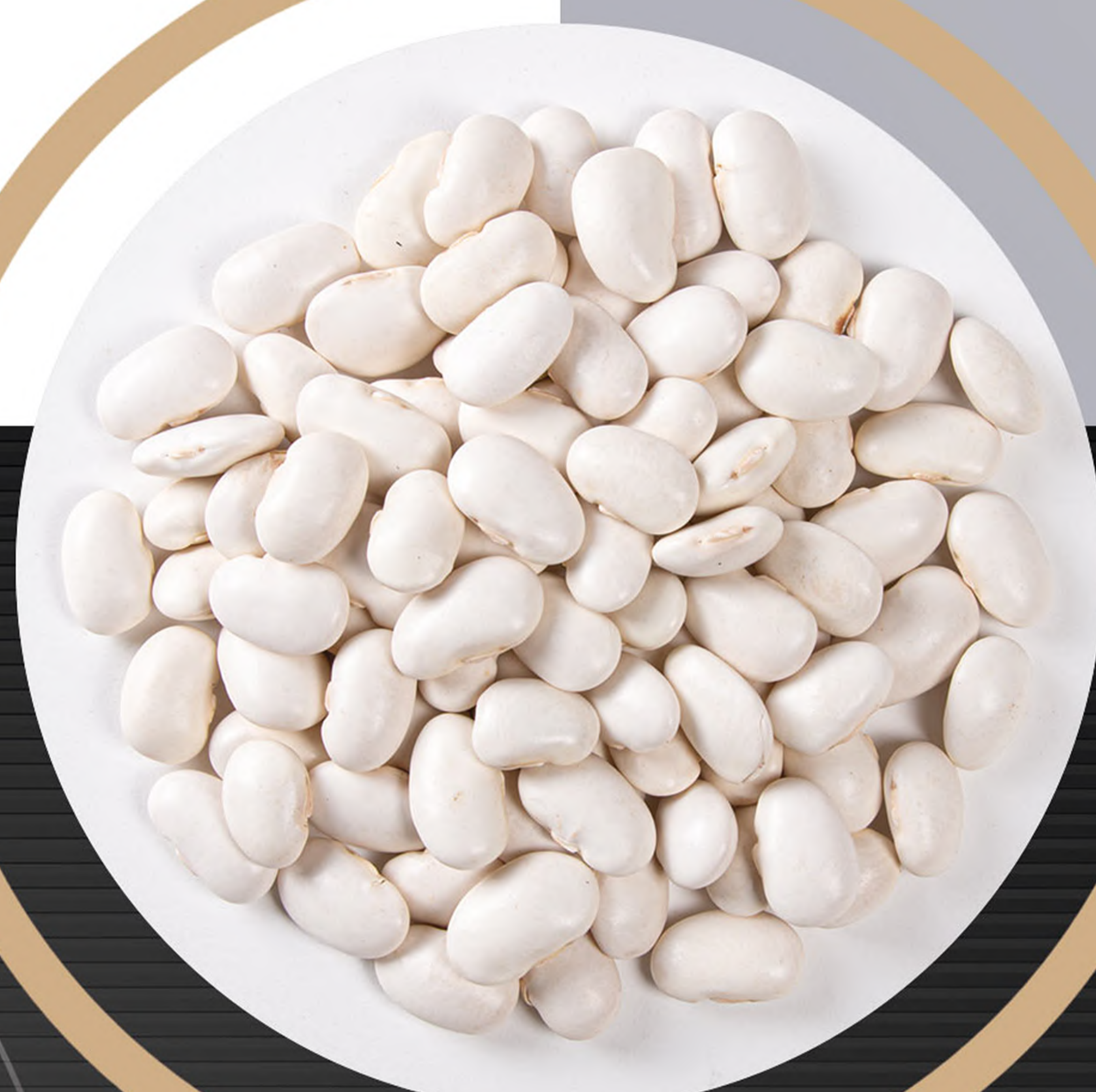
لوبیا سفید White beans