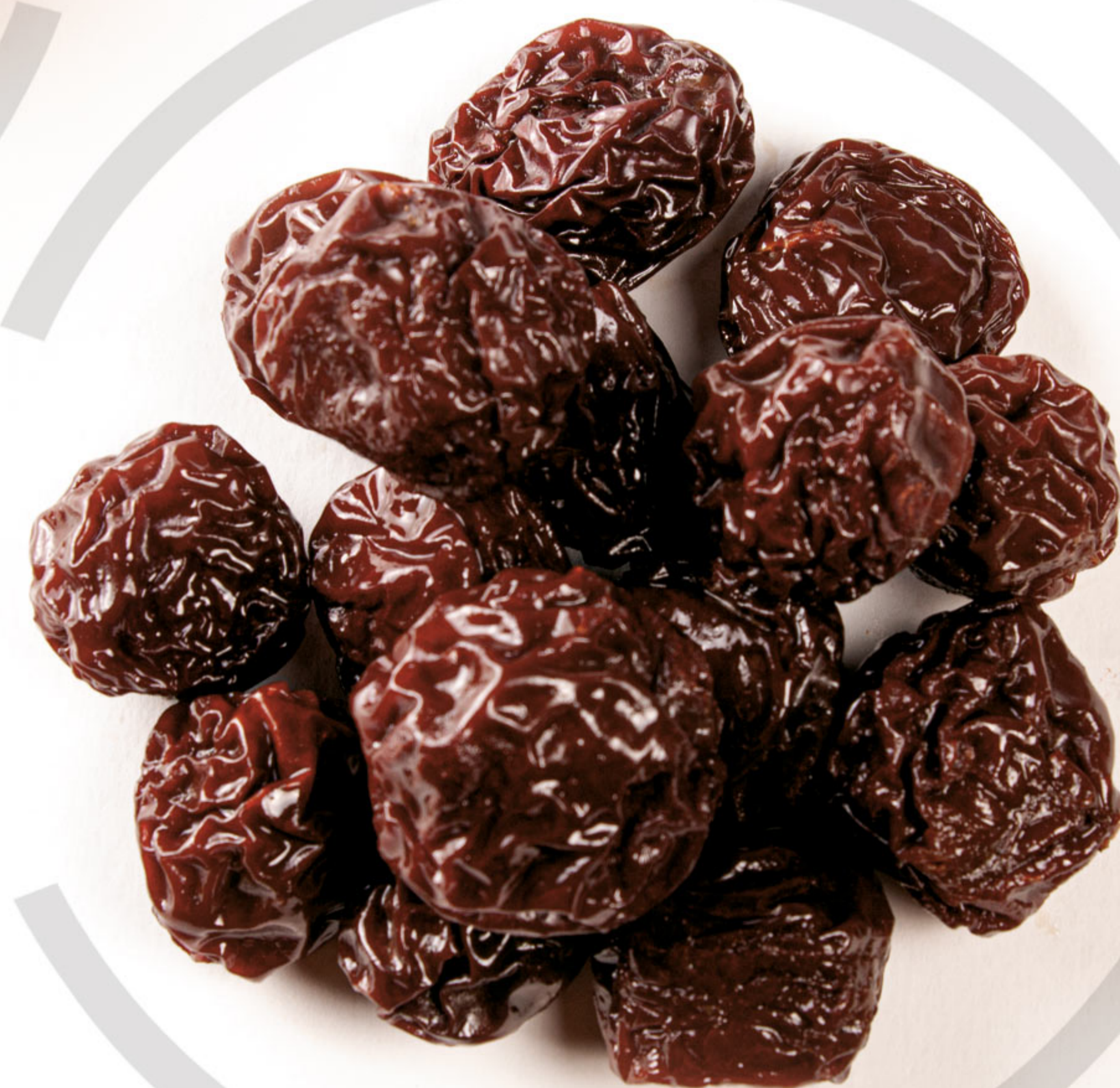
آلوچه مشکی Black Plums