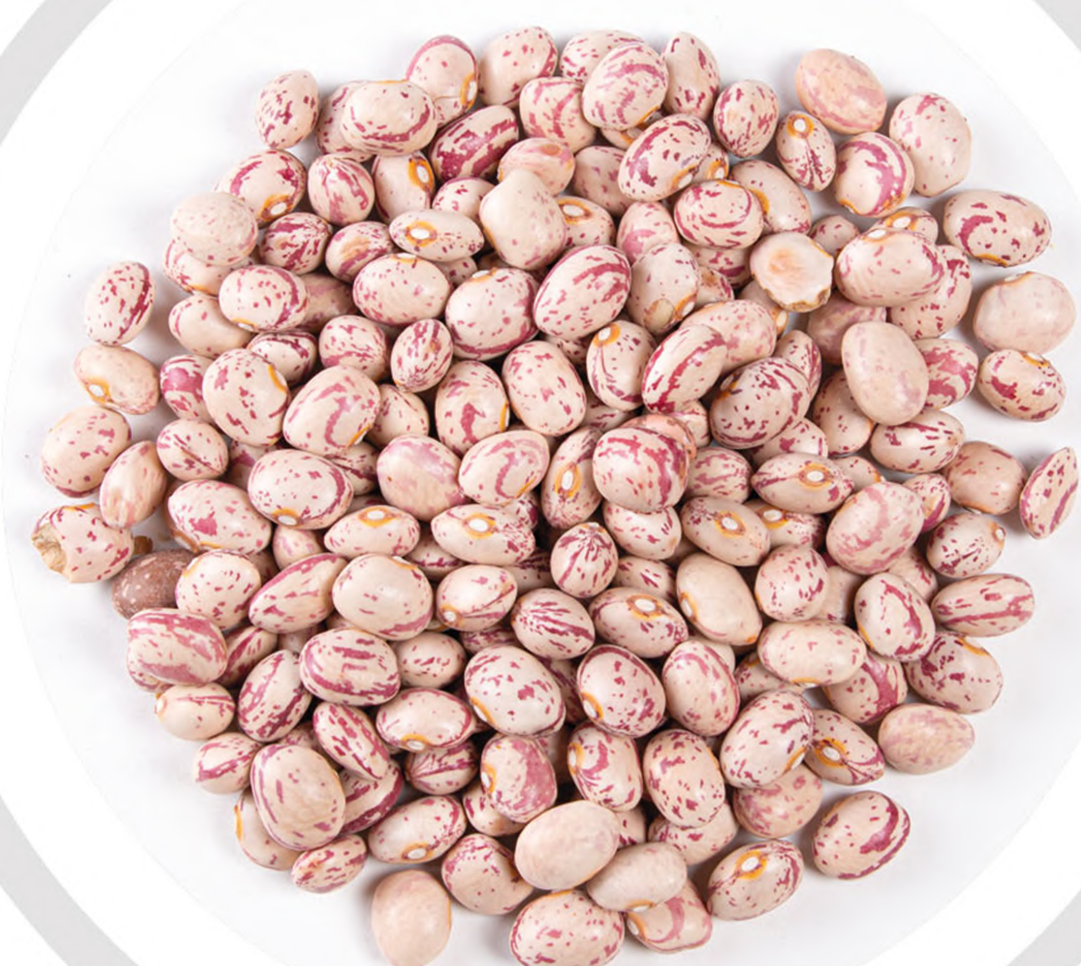
لوبیا چیتی Pinto beans