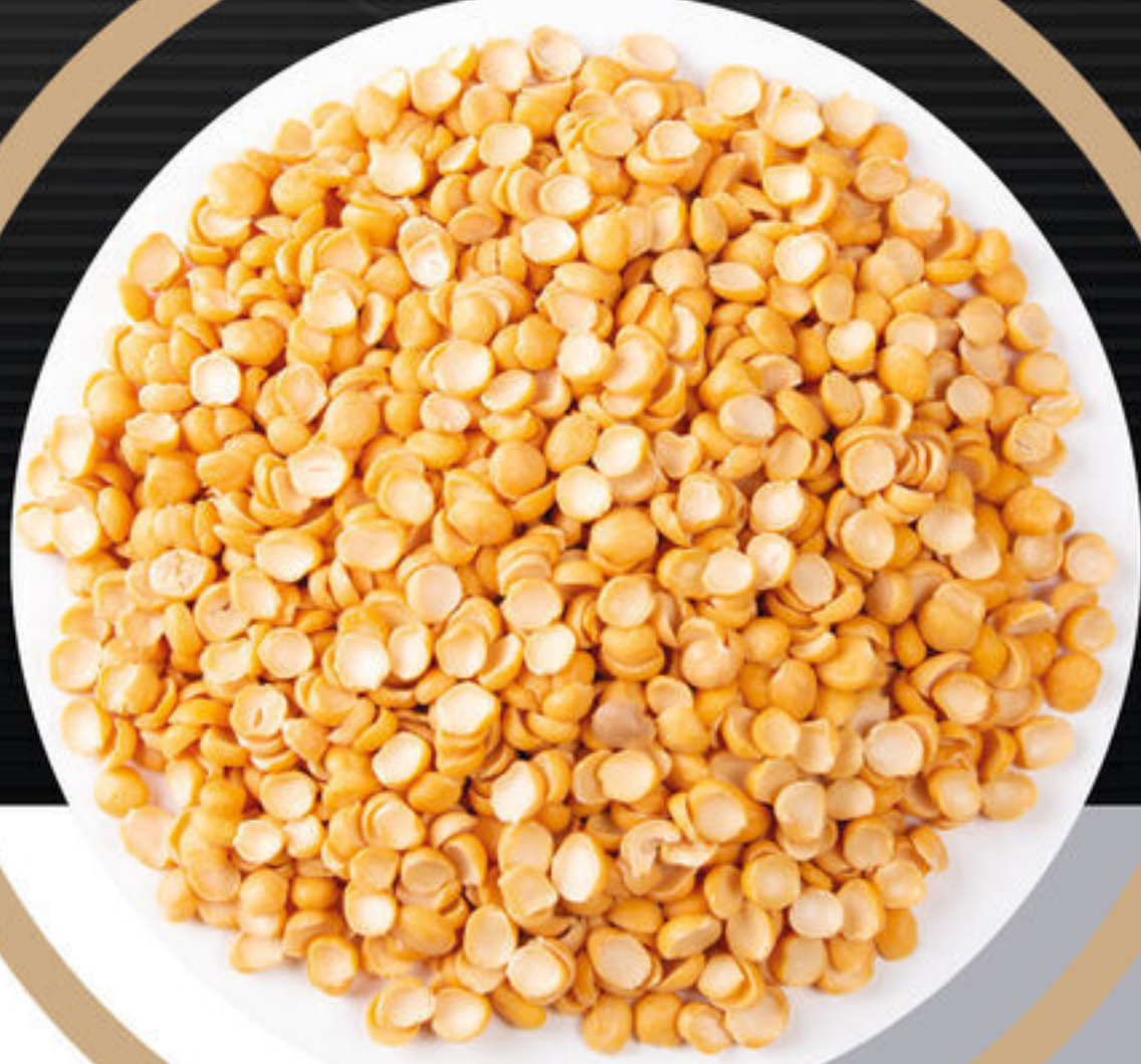
لیہ Split peas