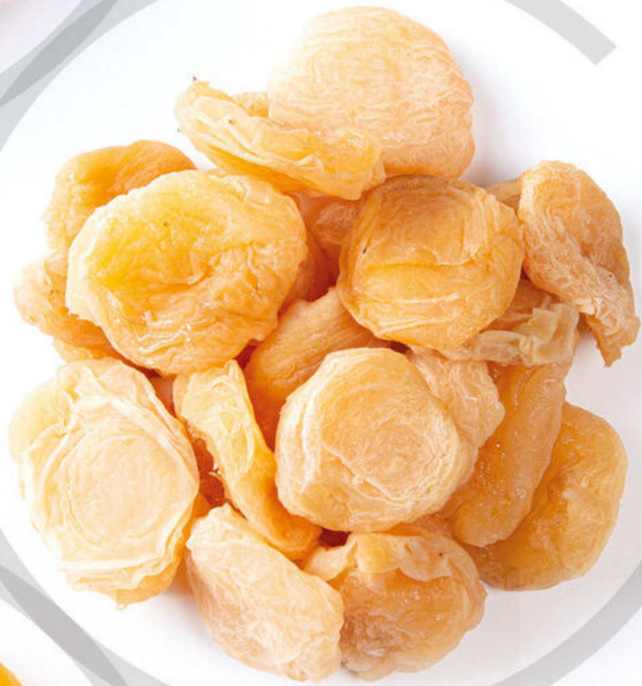
برگه شفتالو PeachLeaf