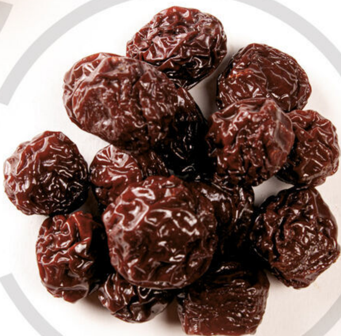
آلوچه مشكى Black Plums