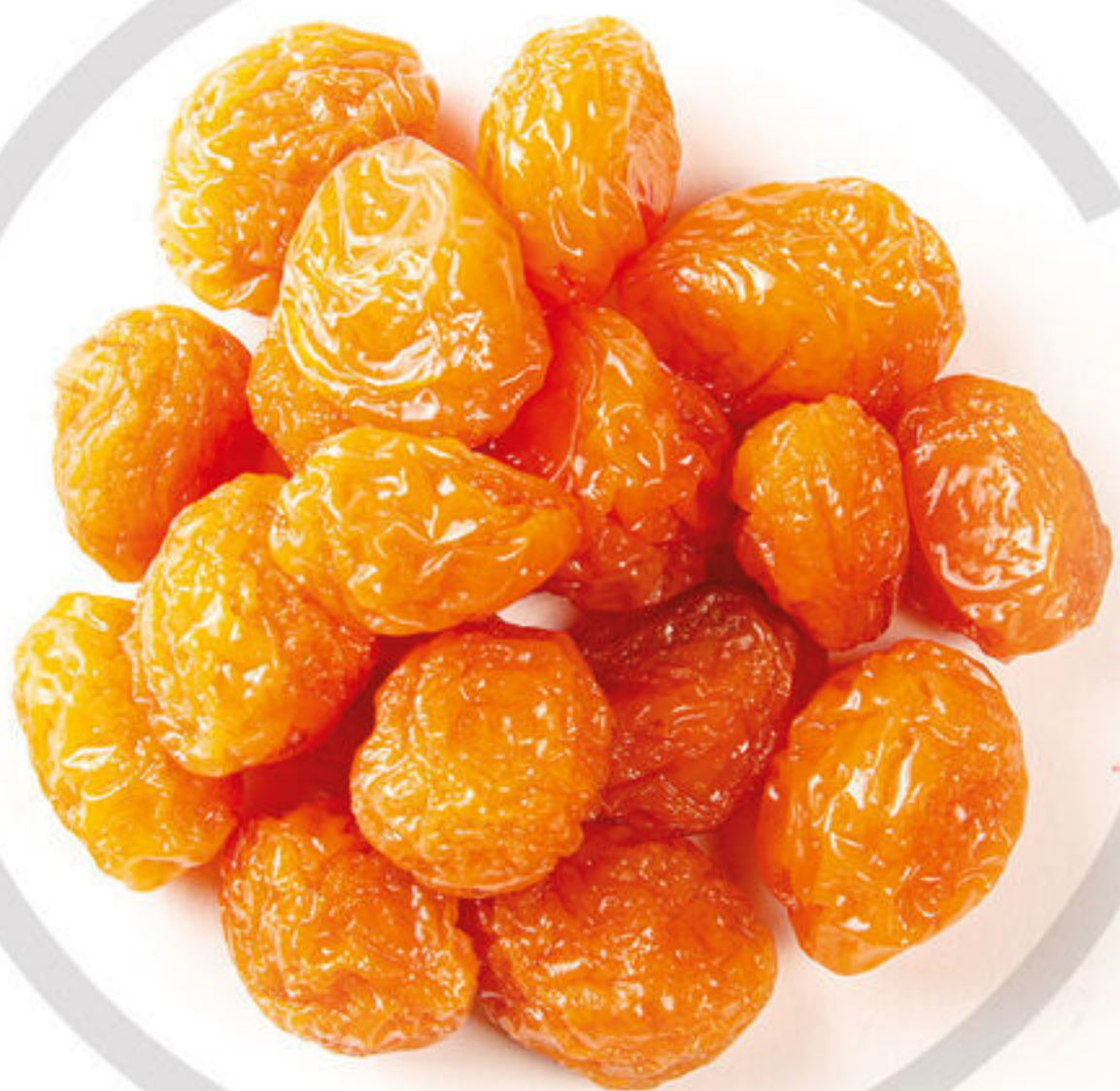
آلو بخارا Prune