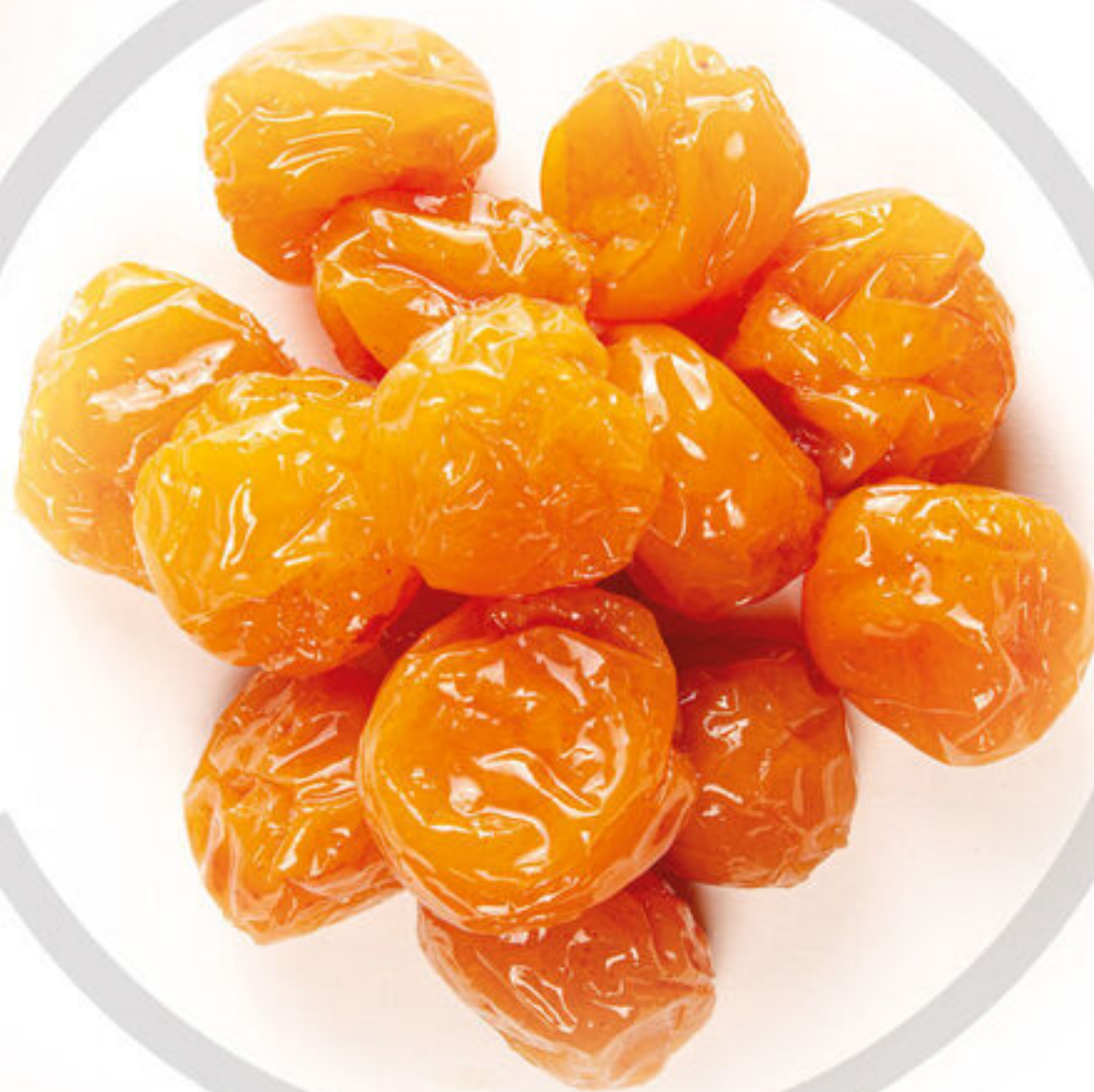
آلوچه زرد Yellow Plums