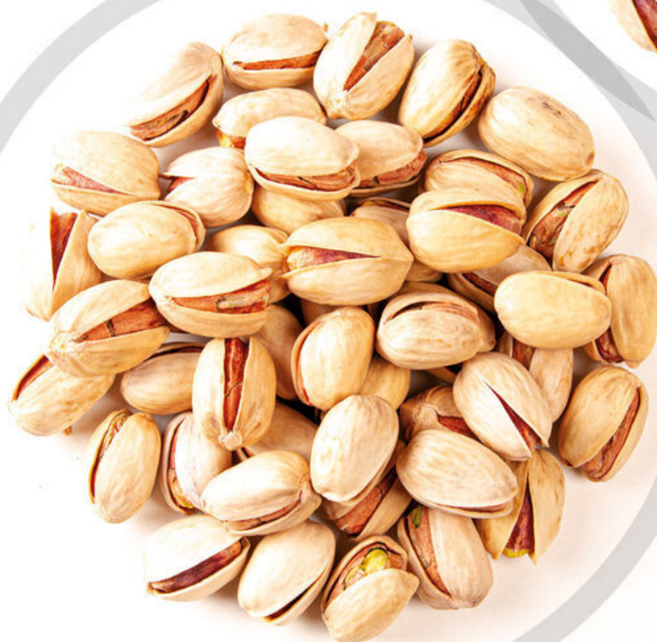
کله قوچی Kalle Ghuchi