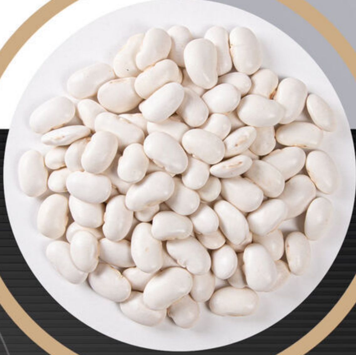
لویا سفید White beans