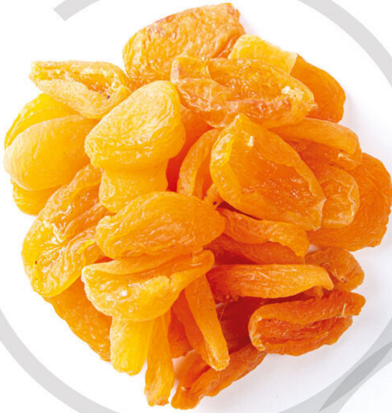
برگه زردالو Zardalo Leaf