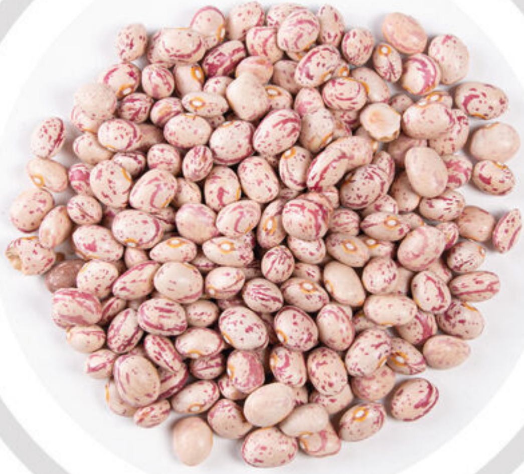
لویا چیتی Pinto beans